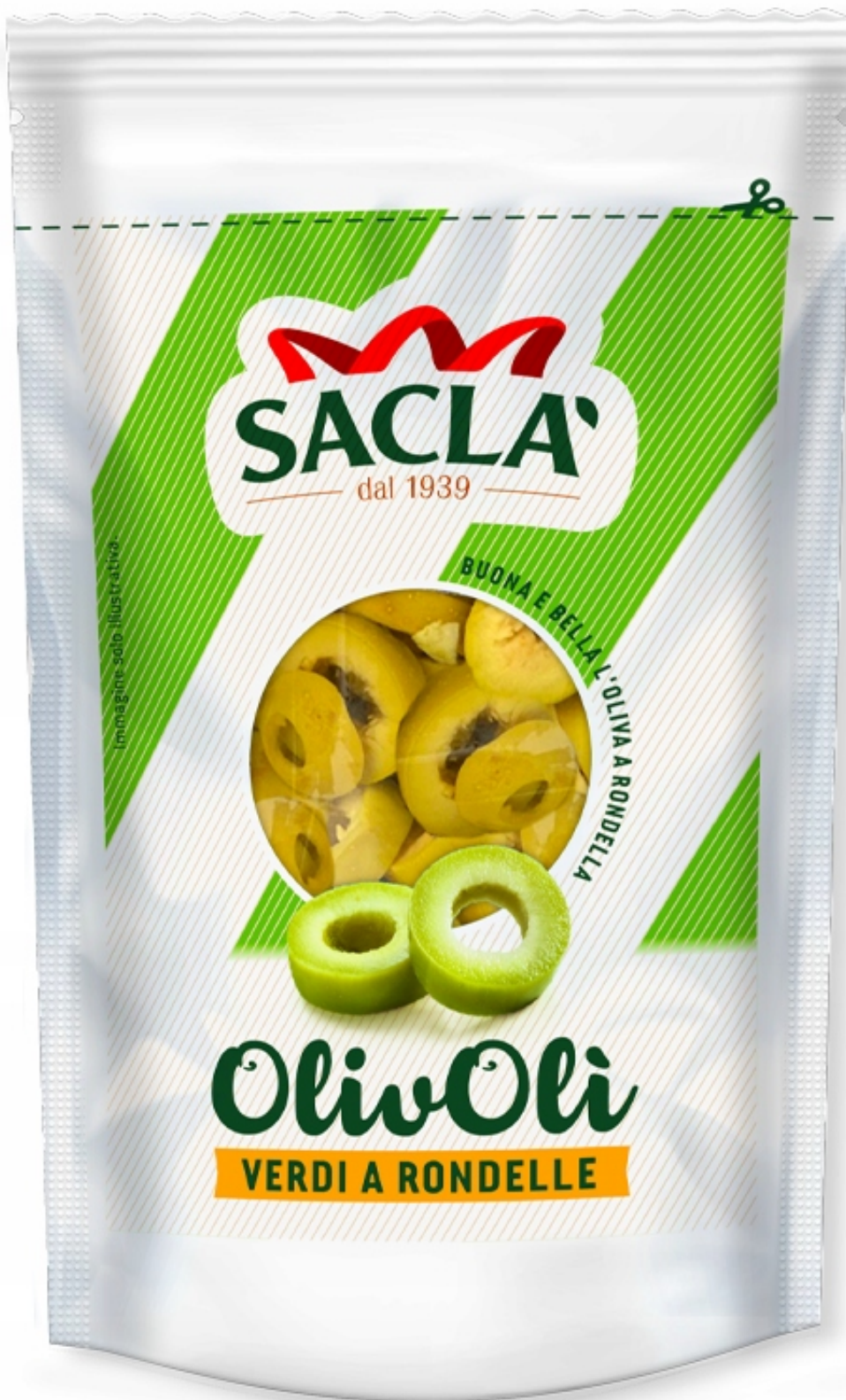
Immagine solo illustrativa.