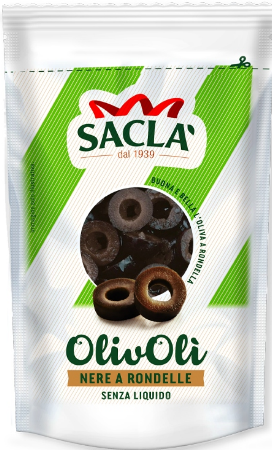
immagine solo illustrativa