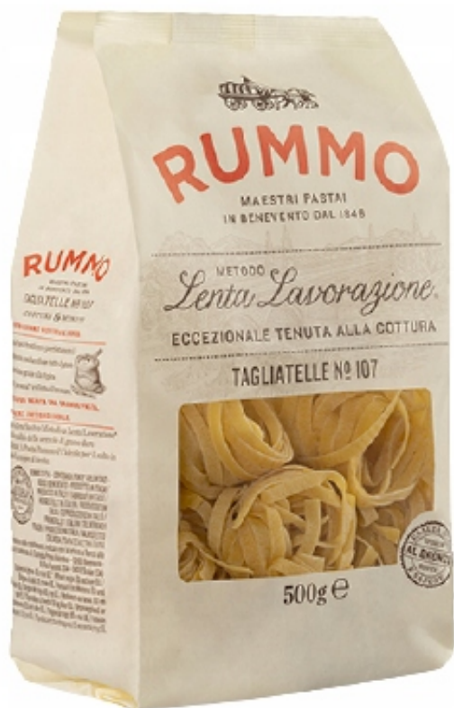
TAGLIATELLE No 107