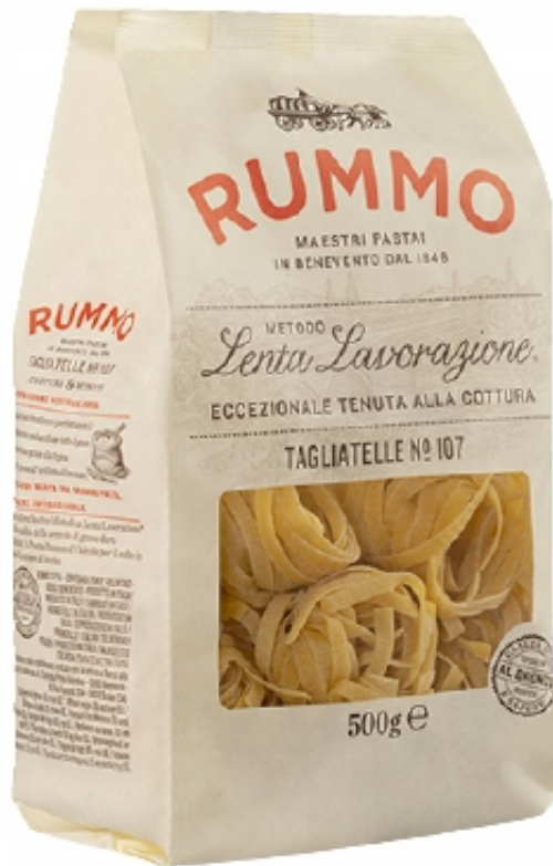
TAGLIATELLE No 107