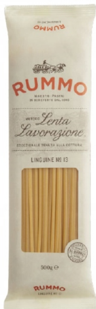
Linguine No 13