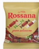
Świetny wybór Rossany