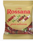
Świętny wybór Rossany