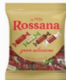
Swietny wybor Rossana