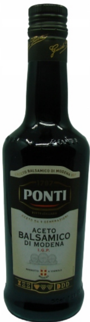
Ocet balsamiczny z Modeny I.G.P. 500ml

Ocet balsamiczny z Modeny I.G.P. Ponti jest wynikiem powolnego dojrzewania wysokiej jakości octu winnego Ponti i moszczu winogronowego, gotowanego i zagęszczanego w kadziach, beczkach i barriques z różnych gatunków drewna i przez różne okresy w zależności od przepisu. Nasze octy balsamiczne z Modeny I.G.P. najlepsze dojrzewają w beczkach o trzech różnych esencjach, z których każda nadaje octowi szczególne właściwości: dąb - delikatny i waniliowy zapach, kasztan - aromatyczna szorstkość taniny i wiśnia - słodki aromat owoców. Beczki są utrzymywane w naturalnej temperaturze w piwnicy z octem, aby uzyskać maksymalne korzyści z klimatycznych zmian pór roku.