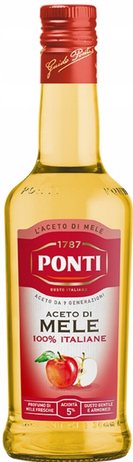
Aceto di Mele