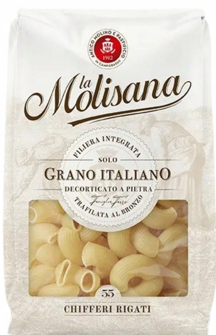
Chifferi Rigati No55 Makaron kolanka karbowane