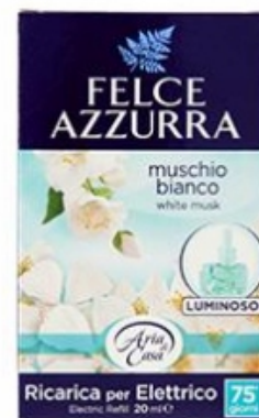
Felce Azzurra Ricarica Diffusore Elettrico Muschio Bianco