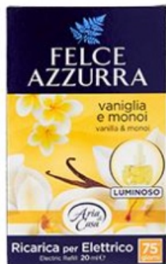
Felce Azzurra Ricarica Diffusore Elettrico Vaniglia