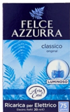
Felce Azzurra Ricarica Diffusore Elettrico Classico

Elektryczny wkład do odświeżacza Felce Azzurra z kwiatami wiśni i piwonią jest idealny do perfumowania pomieszczeń dowolnej wielkości, uwalniając zapach do powietrza stopniowo, ale w sposób ciągły. Eleganckie nuty kwiatów wiśni w połączeniu z wyrafinowaną piwonią dają słodką chwilę harmonii. Każdy wkład gwarantuje aż do 75 dni* otulających i emocjonalnych perfum. * (do użytku 8 godzin dziennie w trybie minimalnej mocy)