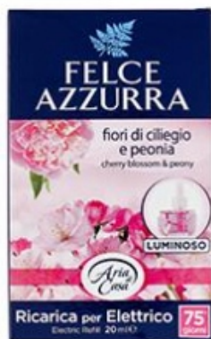
Felce Azzurra Ricarica Diffusore Elettrico Fiori di Ciliegia