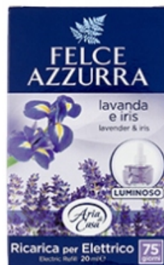
Felce Azzurra Ricarica Diffusore Elettrico Lavanda e Iris