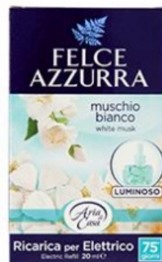
Felce Azzurra Ricarica Diffusore Elettrico Muschio Bianco