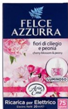
Felce Azzurra Ricarica Diffusore Elettrico Fiori di Ciliegia