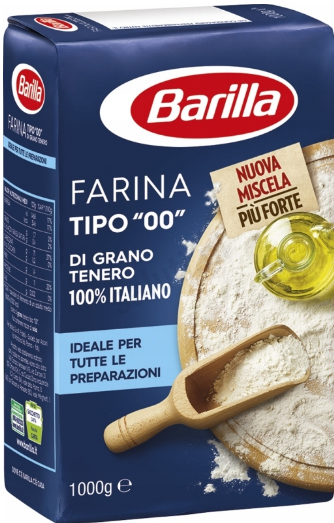
Originalna włoska mąka Barilla ze 100% włoskiej pszenicy typu "00", co oznacza, że mąka jest bardzo dokładnie